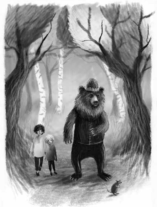
Illustration: Alexander Jansson

Fantastiska Frida Nilsson är tillbaka med en tidlös saga som blandar äventyr med de stora livsfrågorna. En fullkomligt magisk högläsningbok för barn från åtta år och uppåt! /Andrea